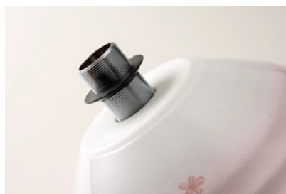
②ボウル裏側に付属の黒いゴムパッキン