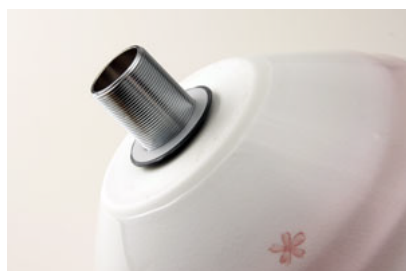
④排水金具付属の薄いスペーサー