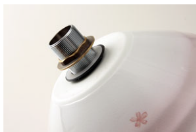
⑤排水金具付属の金色のワッシャー