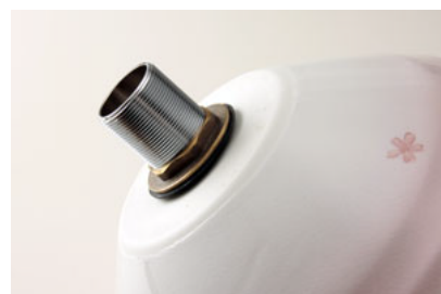
⑥しっかりと締め付ける