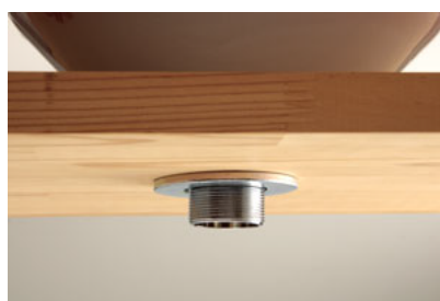
⑧約φ60mmの穴に通し、裏からフランジ付属のワッシャーをはめる。