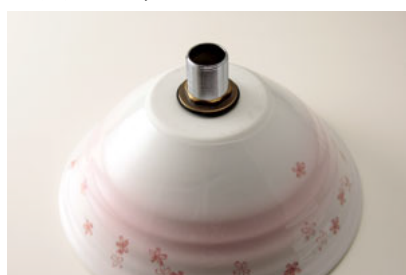
⑦一時取り付け完了裏面にコーキングを塗る