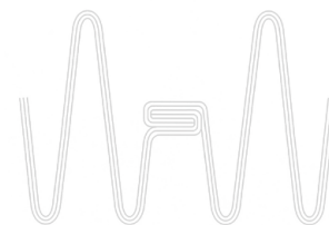
カシメ部断面図(アルミのみ)