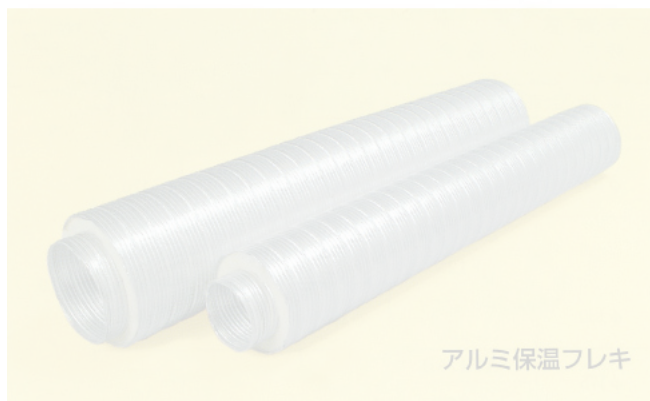
アルミ保温フレキ