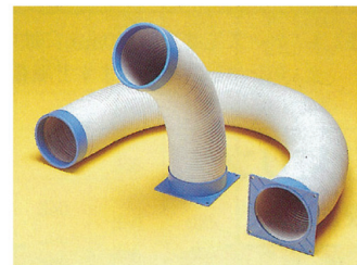
吹出ホースセット