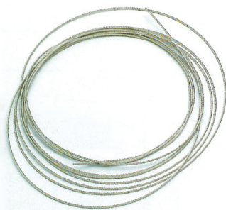
① ステンレスワイヤー (FHS-M)