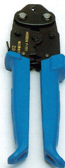
③ 圧着ペンチ (FHS-P)