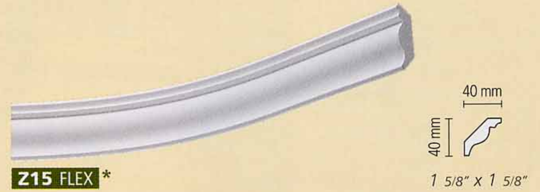
Z15 FLEX *